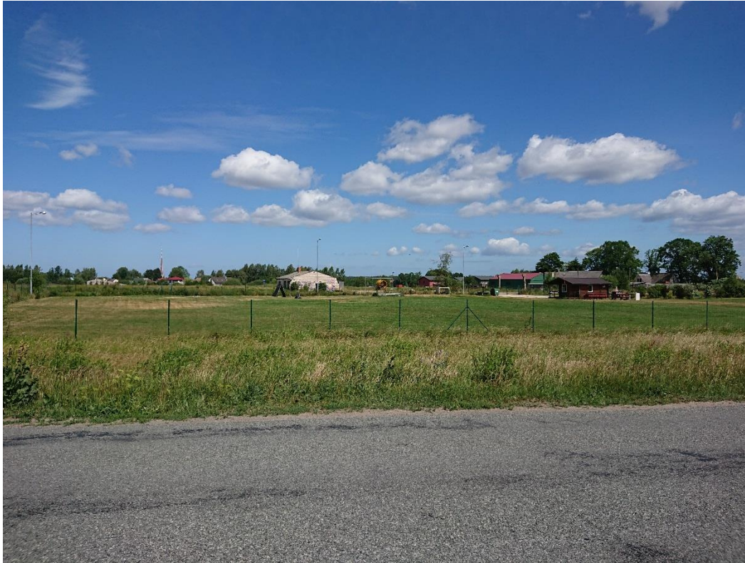
1.attēls. Skats uz detālplānojuma teritoriju no valsts vietējā autoceļa V2