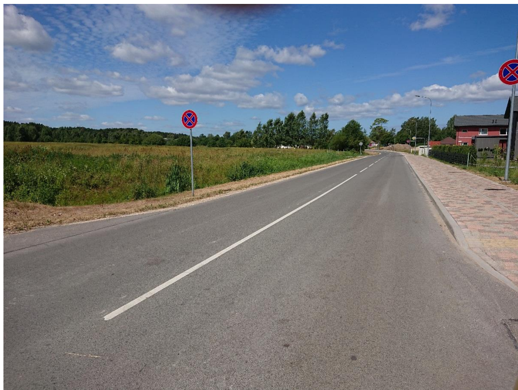
3. attēls. Skats uz detālplānojuma teritoriju no detālplānojuma teritorijas Rāmavas ielas

Detālplānojuma teritorija atrodas Ķekavas novada, Ķekavas pagasta Rāmavas ciemā, ar tiešu piekļuvi no Rāmavas ielas kura ir Ķekavas novada pašvaldības īpašumā esoša iela.